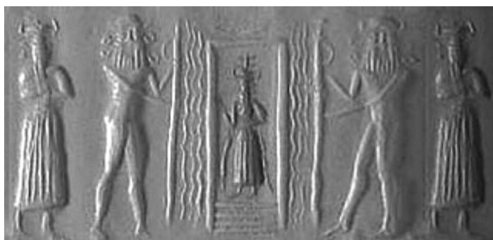
Joonis 2. Akkadi ajastu silinderpitsati jäljend (BM 89771), Briti Muuseum.

mist vetevallaga, on automaatselt üle kantud varasematele perioodidele ilma materjali süvenemata. Tekstide põhjal võiks pigem väita, et Abzut kujutleti teatud allilmas asuva piirkonnana, kust küll võisid alguse saada jõed ja allikad ning mis oli ümbritsetud pinnaveest (sumeri Engur), kuid kuskil ei ole kirjeldatud Abzut kui veega täidetud ookeani. 17 Niisamuti ei ole ka sumeri üks peajumalaid Enki, keda peetakse Abzu valitsejaks, mingilgi moel seostatav terminiga “vetejumalus”. Vetega seob jumal Enkit ehk see, et teda peetakse tihtipeale üldise viljakuse garanteerijaks. Silinderpitsatitel on jumal Enkit aga kujutatud pinnaveest ümbritsetud Abzu templis (joonis 2) ning üheks jumal Enki sümboliks on tema õlgadest välja voolavad veejoad (joonis 3).