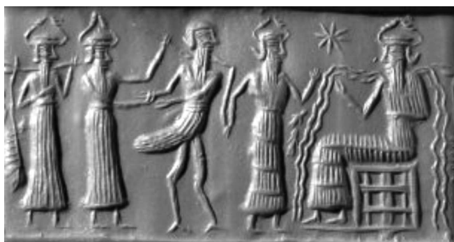
Joonis 3. Akkadi ajastu silinderpitsati jäljend, kaasaegse pealkirjaga “Lindmehe kohtuotsus” (BM 103317), Briti Muuseum.