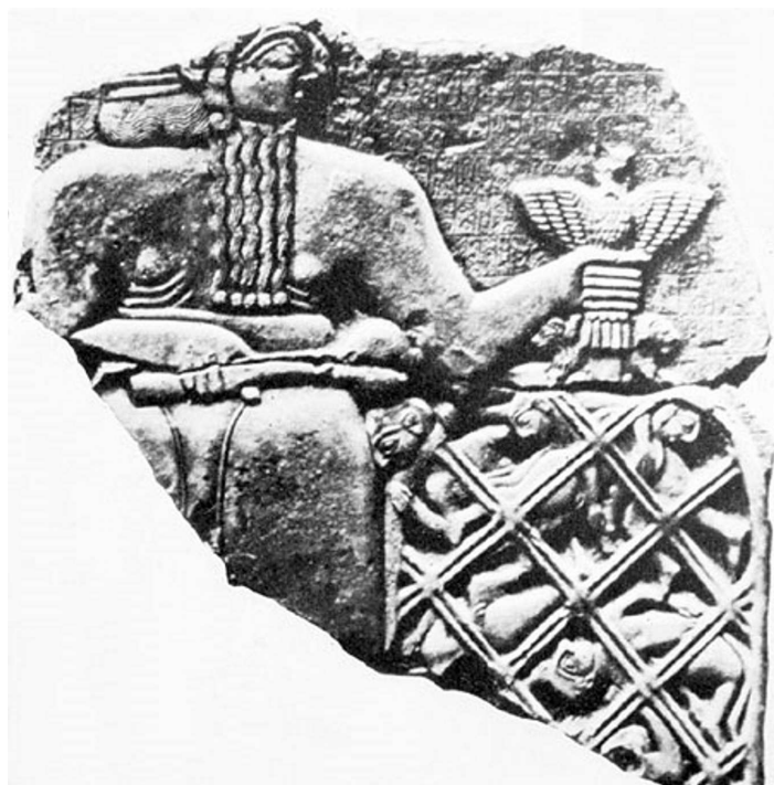
Raisakotkaste steel (Louvre): Jumal Ningirsu, kes hoiab käes suurt võrku, kuhu on vangistatud vaenlase sõdurid. Tema käes olev kotkakujutis on Lähis-Ida mütoloogias tuntud Anzu lind — kõikide hili-semate sõjavägede kotkakujuliste standardite prototüüp.

näidata, et tema koos oma sõjaväega saavutas võidu, kuid tegelikult tagas selle jumal Ningirsu vägi ja jõud. Eanatumi maine võit on ühtlasi võit kosmilise ja jumaliku õigluse sfääris.