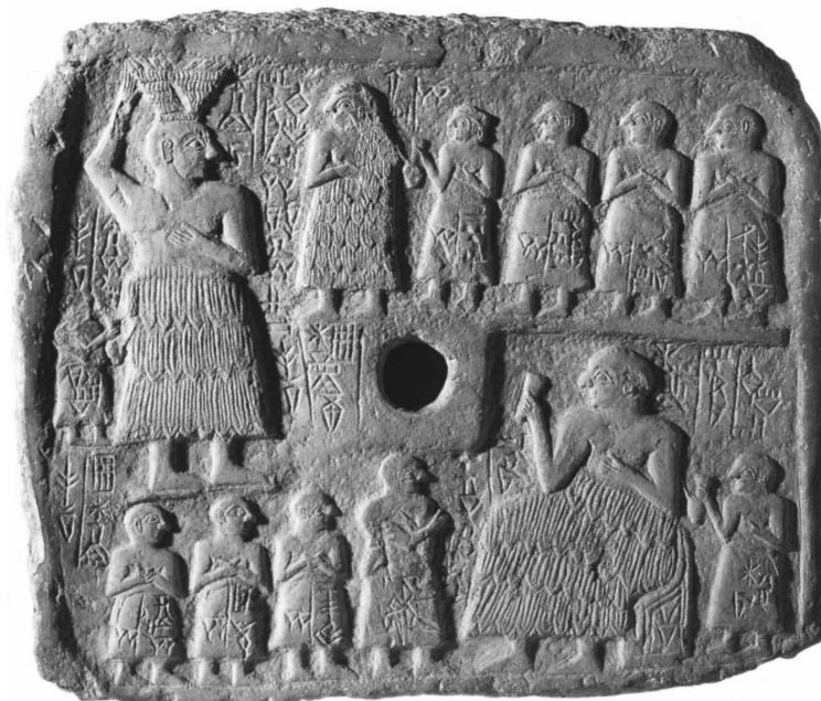
Ur-Nanše pühendustahvel (Louvre).

Lagaši esimese dünastia rajajaks. Ur-Nanše ajast säilinud pühendustahvilil kujutatakse teda koos järeltulijate ja teenijatega. Järgnev illustratsioon kujutab üleval paremal pool ja vasakul alumises osas suurimana Ur-Nanšet.